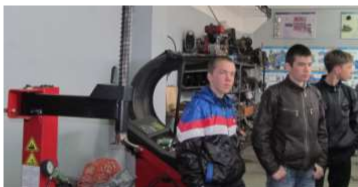
Автолаборатория № 1