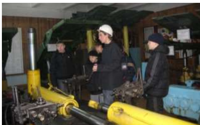
Учебный полигон «Лава»