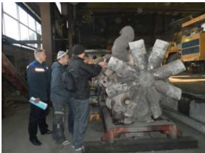
ОАО УК «Северный Кузбасс»