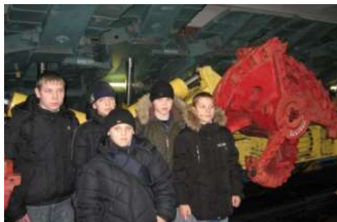
«Ремонтник горного оборудования»