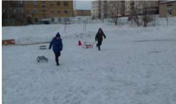
2 этап «Гонка на санках»