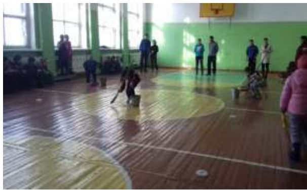
4этап «Бег в мешках»