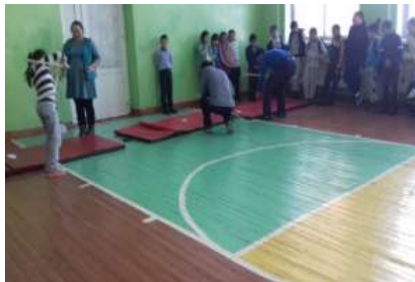
6этап «Полоса препятствий»