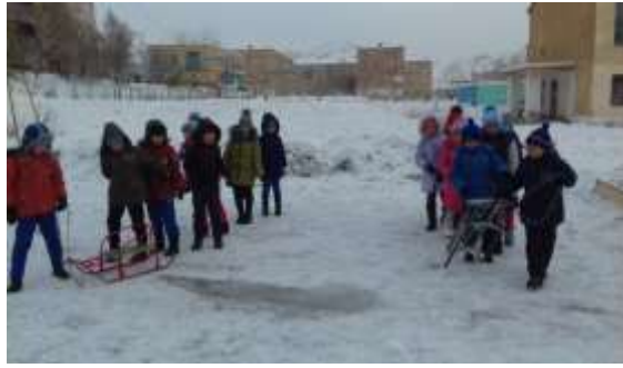
1 этап «Бег санками»