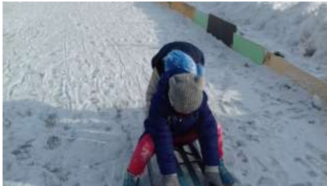
6этап «Гонка на санках стоя»