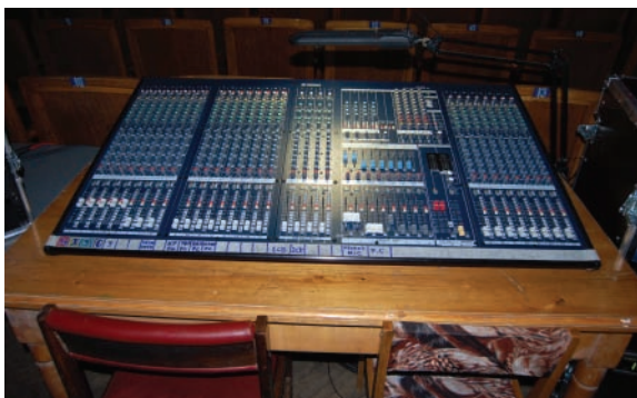
Yamaha IM8 на месте звукорежиссера – прошло буквально несколько дней, как получили груз

До сих пор в интернете об этом пульте мало информации, так как модель не так давно появилась на рынке. Производится только в Японии, что, несомненно, говорит об отличном качестве сборки. При приобретении надо учитывать, что блок питания PW8 в комплект поставки микшера не входит и продается отдельно!