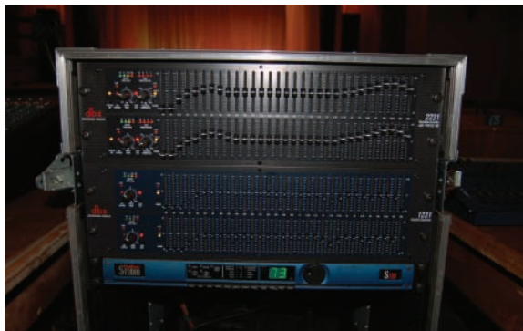
Приборы обработки звука. Сверху вниз: dbx 2231-EU (для FOH), dbx 1231-EU (для мониторов), голосовой процессор DigiTech S100

DigiTech S100 – вполне «рабочая лошадка» с двумя отдельными процессорами (engine) в одном приборе. Я в работе подключаю их как один – два вместе параллельно или последовательно, такая возможность есть. Получается более «жирный» звук. А вообще у нас в зале столько реверберации, что создавать искусственную и не надо, вокал будет только грязней и неразборчивей. Да и риск получить обратную связь с микрофонами увеличивается, если дать чересчур много эффекта в мониторы.