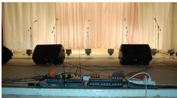
Приемники и передатчики радиосистем

У этих микрофонов неудобная установка элементов питания и неудобный переключатель питания передатчиков, не предусмотрена возможность установки на стойку. Недостаточна у них ветрозащита, микрофоны сильно «задуваются» и необходимо использовать в работе дополнительные ветрозащитные