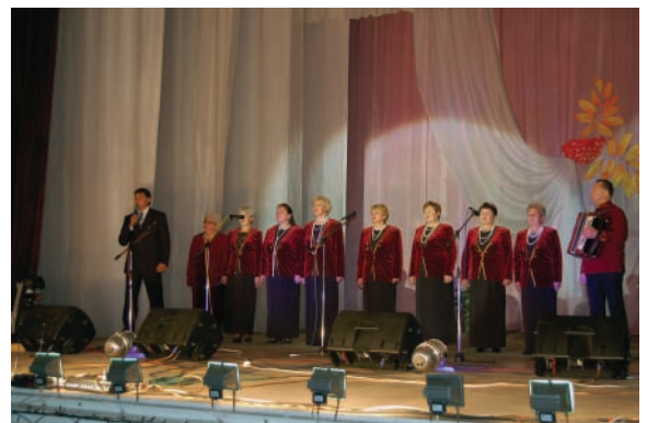
День пожилого человека. Две линии сценических мониторов, по две АС Alto PS5L на линию. На момент съемки было проведено только одно мероприятие на новом аппарате

После изучения информации в интернете (статьи, форумы и т.д.), консультаций со знакомыми специалистами, мучительных раздумий и подгонки цен под наш бюджет я остановился на следующем списке оборудования, который был разбит на три части, чтобы антимонопольщики не обвинили в нецелевом использовании денежных средств.