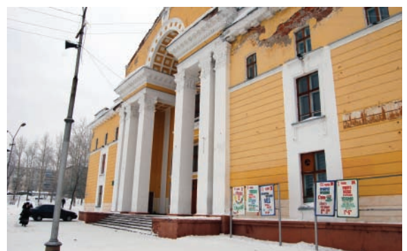
Вот и наш Дворец культуры. Для своих более шестидесяти лет еще хорошо сохранился...