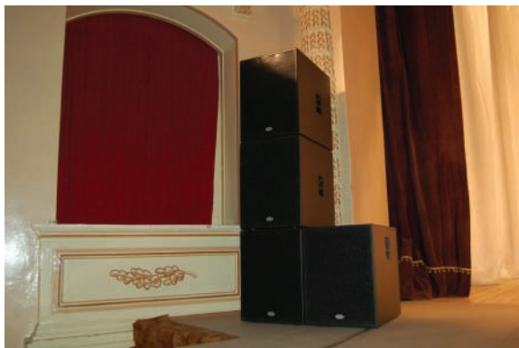
Так располагаются акустические системы

Это акустика от известного российского производителя – компании Media Works. Прежде всего, подключать эту акустику надо, пользуясь качественным спикер-процессором, но нам на момент выбора аппаратуры это было не по карману. Я изначально и не предусматривал возможность трехполосного усиления (триампинга), ведь это дополнительные расходы еще на один усилитель мощности и недешевый акустический кабель и разъемы – хотя наш старенький dbx 234XL и предусматривает возможность делить на три полосы в стерео.