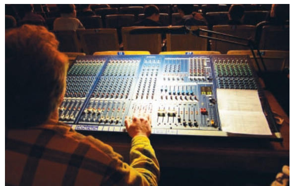
Во время проведения мероприятия