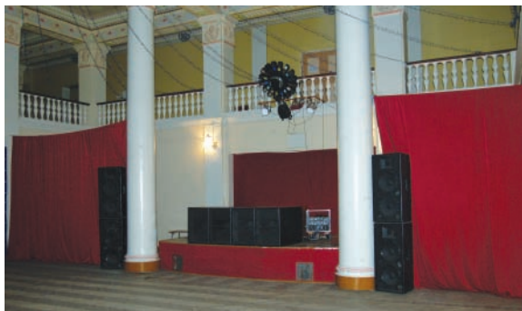
Так у нас установлены акустические системы в фойе

Этот комплект был куплен с рук у крупной пермской прокатной компании в 2002 году в уже изрядно изношенном состоянии, но, по их словам, с новыми головками. После предыдущего аппарата (2 кВт тяжеленного, но маловразумительного самопала) этот был просто пределом мечтаний: более 13 кВт довольно приличного звука с отличным звуковым давлением. Если судить по данным изготовителя, получается около 146 дБ пикового давления субвуферов и 144 дБ сателлитов. Что, конечно, довольно неслабо!