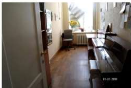
Φοτο Νο 164