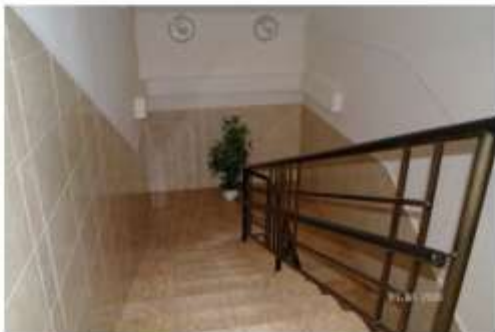
Φοτο Νο 403