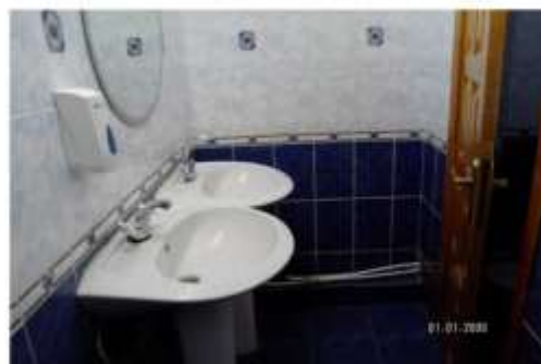
Φοτο Νο 125