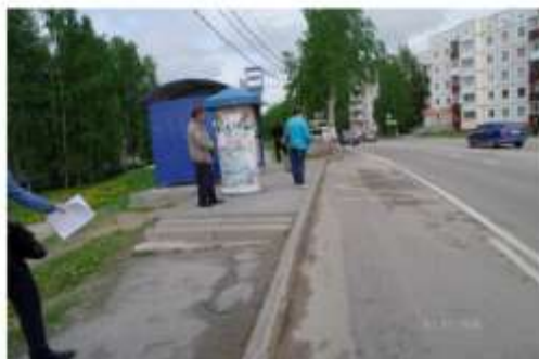
Фото № 7