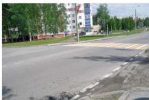
Фото № 33