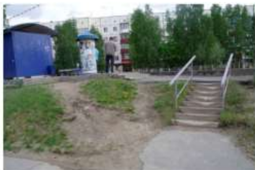
Фото № 9