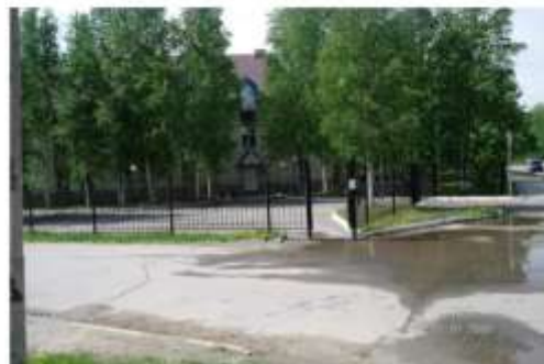
Фото № 34