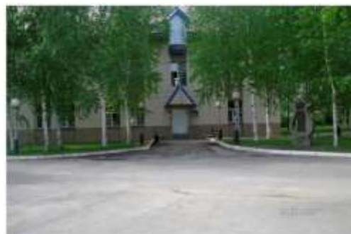
Фото № 47