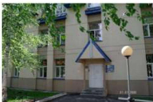
Φοτο Νο 92