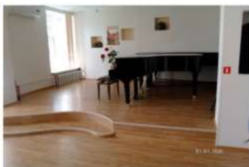
Φοτο Νο 224