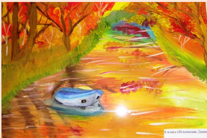
Ильинская Диана, 6 класс