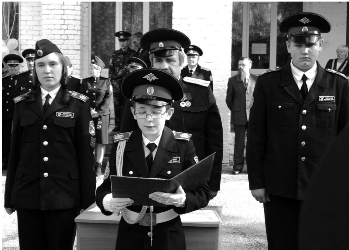
Торжественную клятву пятиклассников принимают казаки.

Пройдя процедуру аккредитации Министерства образования Пермского края, школа получила статус «Кадетская школа». Это многое изменило, и прежде всего – внутренний уклад: единая кадетская форма, еженедельное