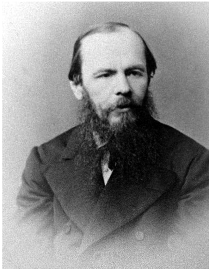
Федор Михайлович Достоевский.

Самый знаменитый отечественный литературный критик В. Г. Белинский, весьма активно проповедовавший социалистические идеи, увидел в молодом писателе нового глашатая революции. Разочарованию «неистового Виссариона» не было предела: двое его любимых и очень талантливых «физиологов Петербурга», Гоголь и Достоевский, оказались никудашными революционерами: Гоголь стал ревностным христианином, а Достоевский, несмотря на определенную близость его раннего творчества с гоголевским, считал, что стране нужна вовсе не революция, а возвращение к чистоте православной веры.