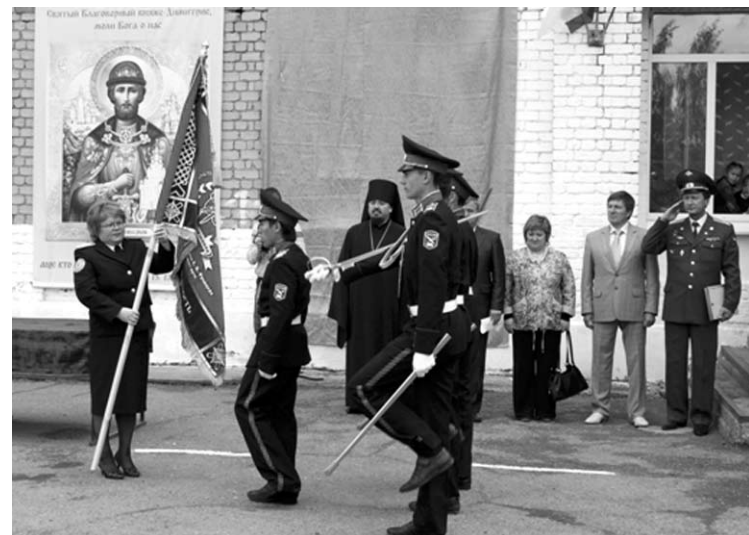
Директор школы передает новое знамя знаменной группе.