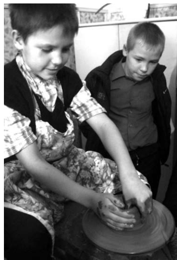
Мальчишки с удовольствием осваивают казачьи промыслы.

Программа мероприятия оказалась предельно насыщенной. Буквально в первый же день после регистрации участников и их размещения прошло всеобщее построение, на котором были сформированы отряды. Ребята получили задания, после чего началась интенсивная работа секций. Детей знакомили с основами живописи и гончарного дела, с верховой ездой и казачьими песнями, приобщали к русской православной культуре. Занятия строились так, чтобы отряды побывали на каждой из секций, а дети смогли попробовать свои силы во всех направлениях и выполнить задания различной сложности и на любой вкус. По