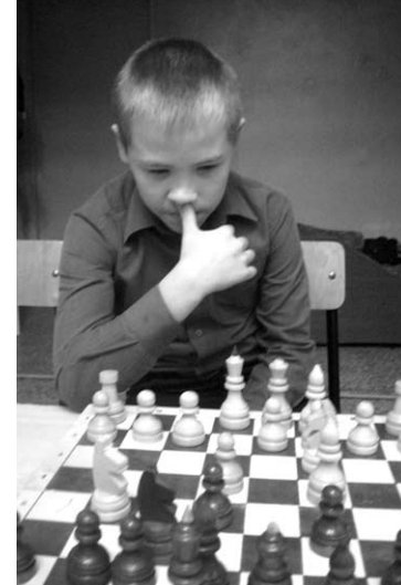
Шахматы – задача не из легких.

вечерам для подростков была подготовлена музыкально-игровая программа.