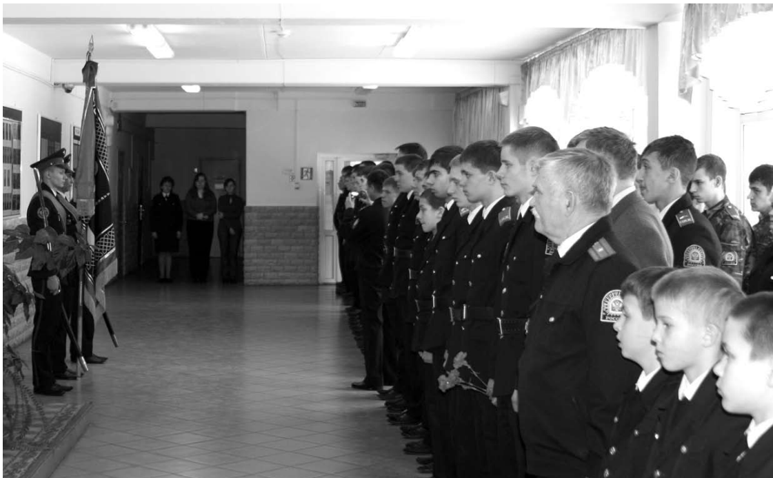
Равнение на знамя!