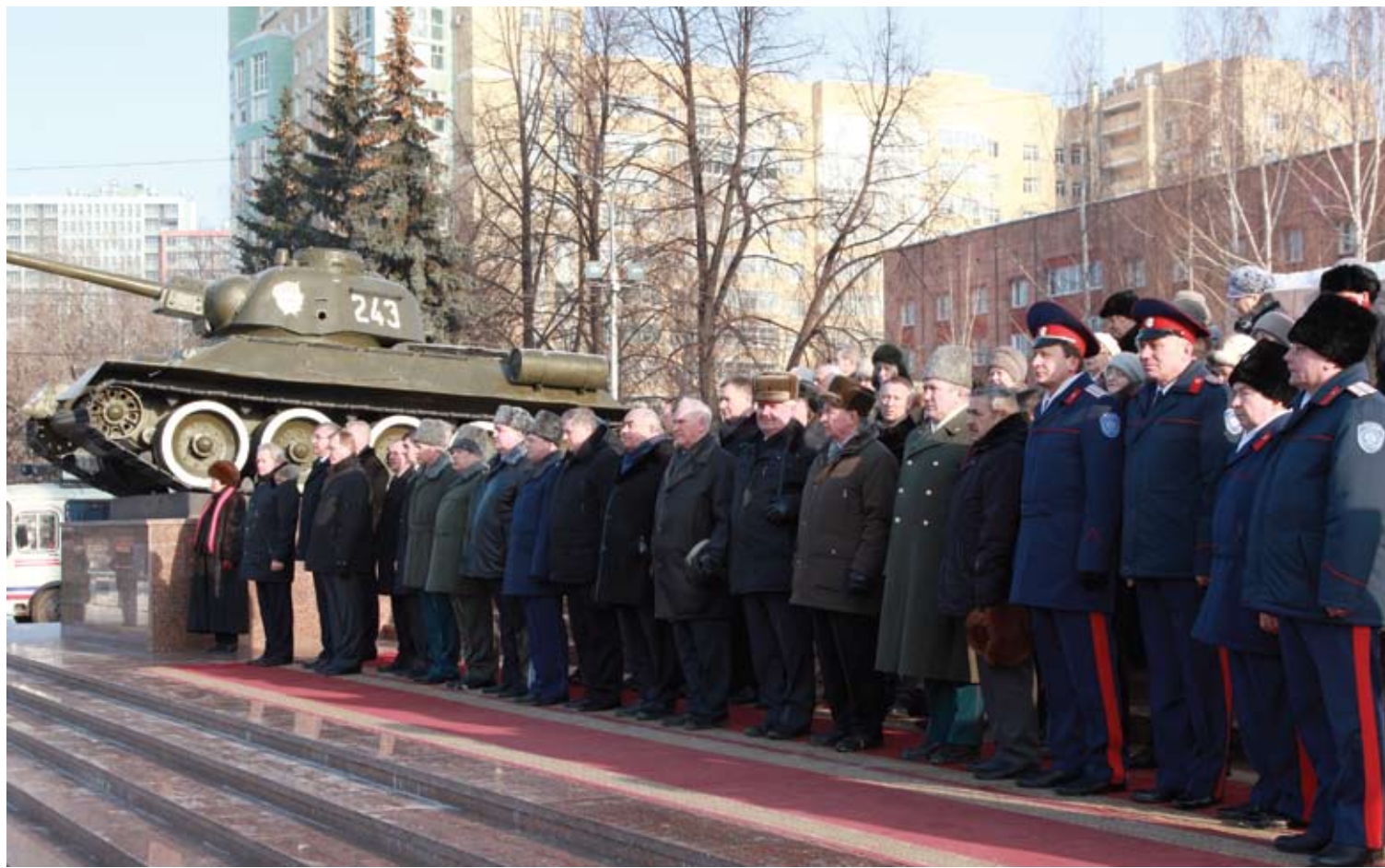
Память воинов почтили минутой молчания.

В прошедшем году были разработаны следующие документы: Концепция традиционного духовно-нравственного воспитания, развития и социализации обучающихся в казачьих кадетских корпусах, Положение о войсковом священнике и епархиальном отделе по взаимодействию с казачеством, Внутренний Устав казачьего общества и Устав православного кадета.