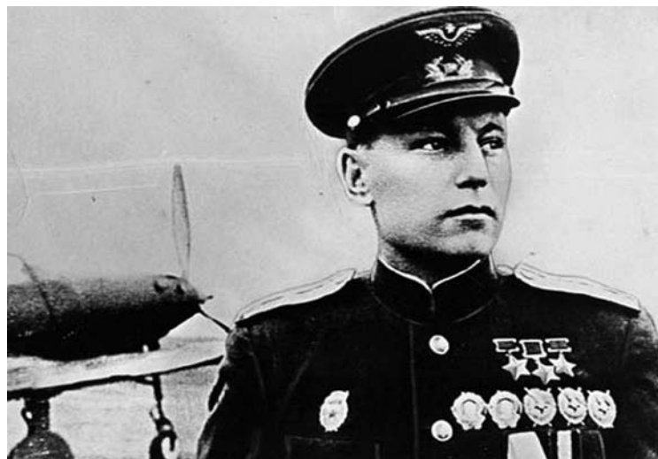
Трижды Герой Советского Союза А. И. Покрышкин.

должен сам подниматься в небо на планере, позднее – в качестве летчика-наблюдателя на «Р-5». Одновременно совершенствует навыки спортсмена – гимнаста, стрелка, велосипедиста.