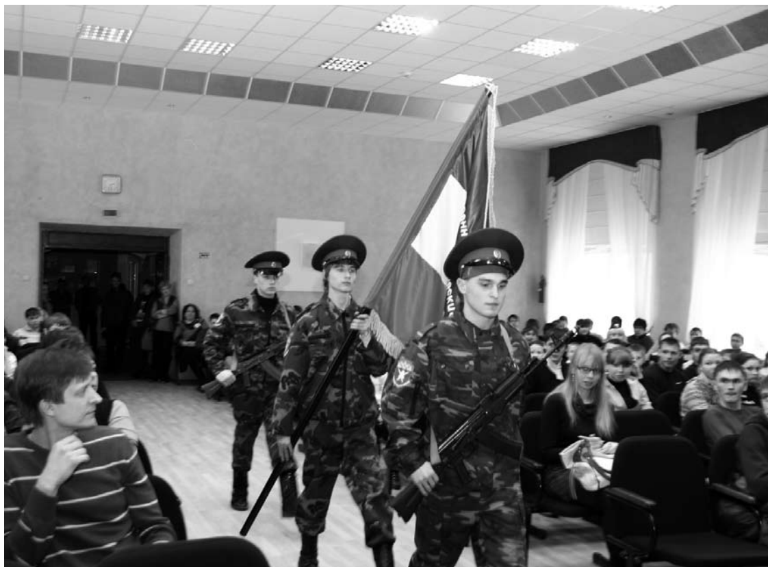
Знаменная группа клуба «Отчизна».

заставляет нас опасаться за будущее клуба.