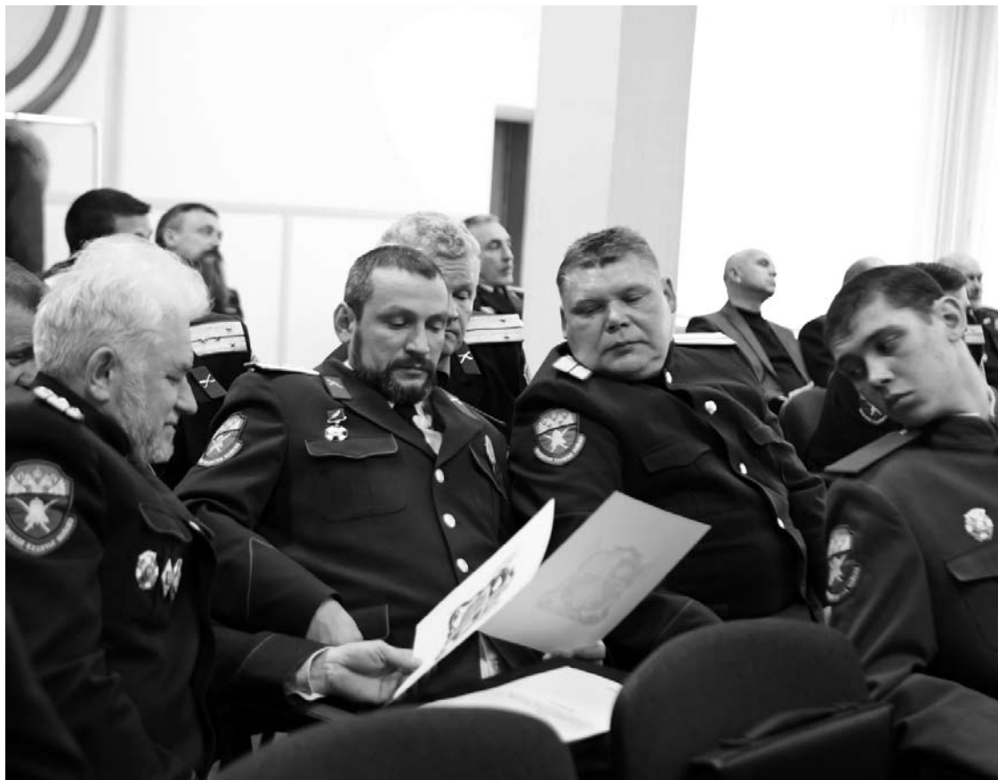
Идет обсуждение символики СЗКО.

— На сегодняшний день в округе 17 казачьих обществ. Свыше 2 тысяч казаков взяли на себя обязательства по несению госслужбы. При этом в системе дополнительного образования по линии патриотического воспитания задействовано всего 15 казаков и 209 подростков. Только 7 казачьих обществ активно работают в казачьих классах, ребят в этих классах — 874 человека. Цифра немаленькая, но заслуга ли это только казаков? Без волевого решения администрации края вряд ли бы у нас появился Новоильинский казачий кадетский корпус и кадетские классы в Чернушке. Общее число детей, обучающихся с так называемым казачьим компонентом, составляет около 1 тысячи человек. Это менее 5% от общего количества детей в крае.