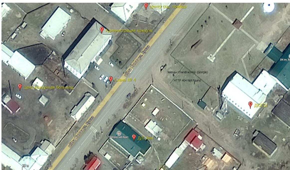
Схема № 4 (возле Администрации Тес-Хемского кожууна) ул. А.Ч.Кунаа, д. 58