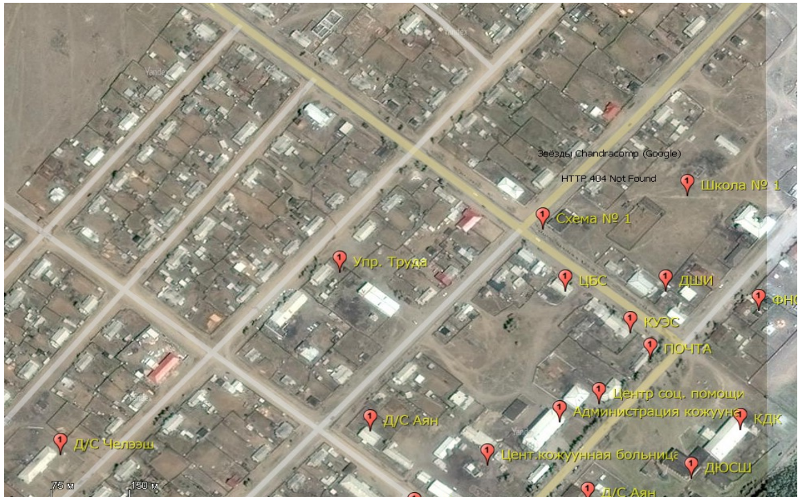
Схема №1 (возле Самагалтайской СОШ №1) – ул. Дружба, д. 32/1