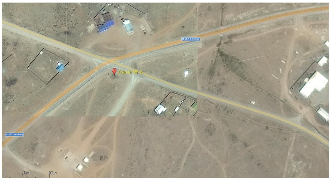
Схема № 2 (972 км. автодороги р-257) ул. Туглуга 1/1