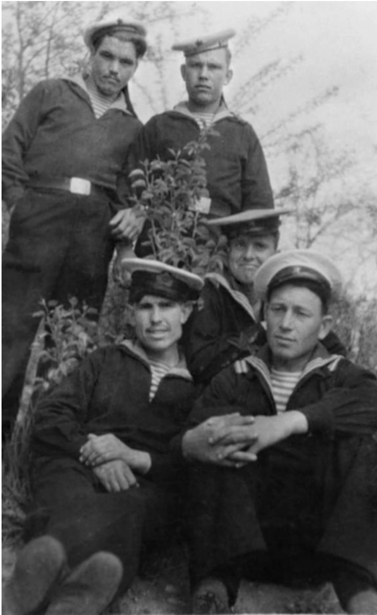
11 мая 1948 г.