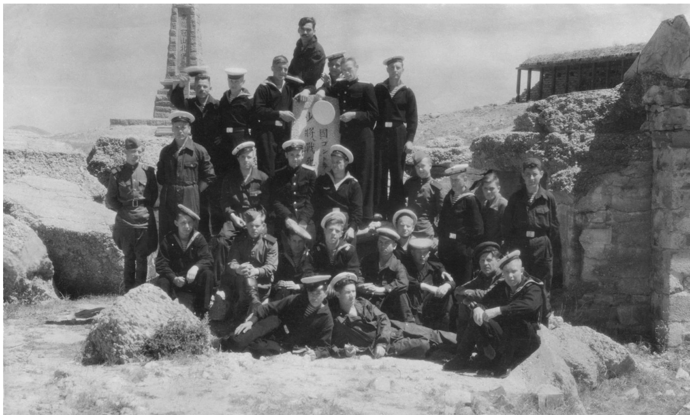
На могиле генерала Кондратенко