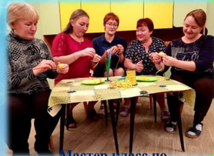
Мастер класс по изготовлению флюгеров