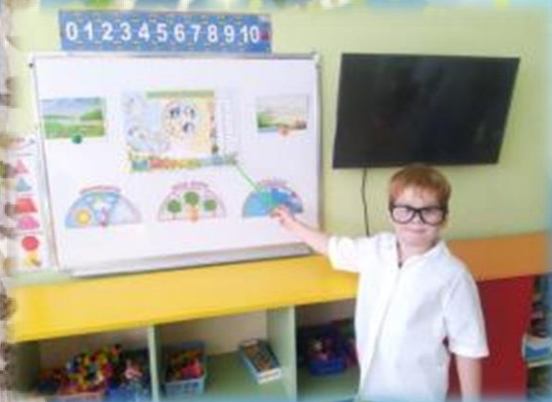
Сюжетно-ролевая игра «Юные синоптики»