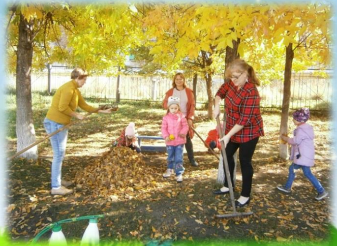
Уборка территории метеостанции