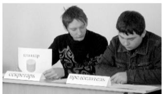
"Геометрический симпозиум" в гр. 92