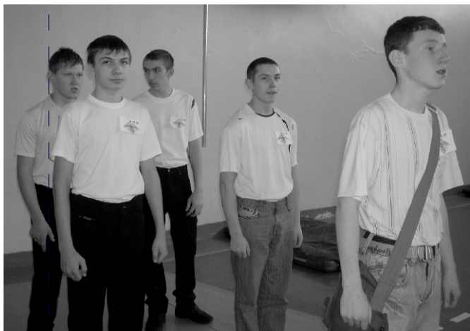
Команда гр. 91