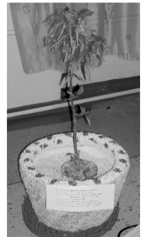
Вазон под цветы