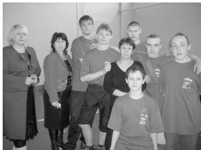
Команда гр. 99 и 96 с мастерами ПО и куратором