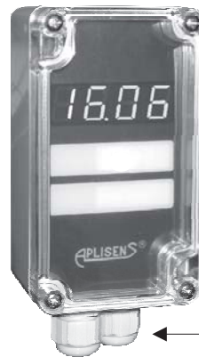
Индикатор PMS-11N Габаритные размеры 115×65×55 мм

Индикатор PMS-11K предназначен для совместной работы с любым устройством, имеющим выходной сигнал (4 ÷ 20) мА и оснащенный на выходе стандартным штепсельным разъемом типа DIN 43 650. Основным применением указателя является совмещение местного контроля с дистанционным контролем измерения давления или разности давлений. Индикаторы PMS-11K имеют возможность конфигурации диапазона показаний от -999 до 9999 и позиции десятичной точки. Оснащены дисплеем LED (красным) с высотой цифр 7,62 мм, а также программируемым дискретным выходом типа открытый коллектор (OC). Индикатор не требует дополнительного питания.