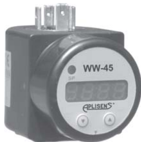
Индикатор PMS-11K (WW-45)