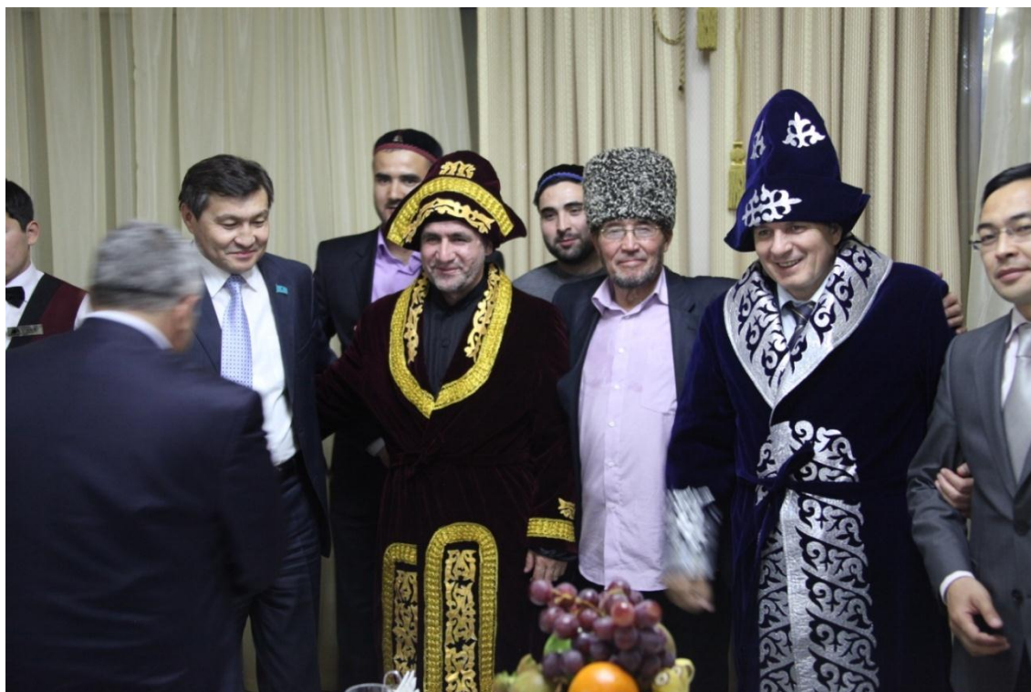
Уважаемым гостям казахские чапаны очень идут!