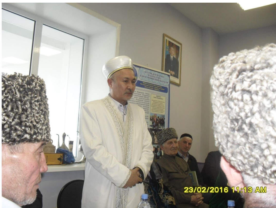
Презентация книги «Дружба на века» в офисе ЧИЭКО «Вайнах»